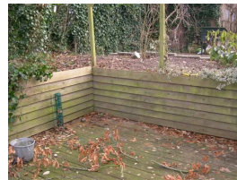
materiaal en materieel nieuwe zitkuil oude zitkuil

Bij de garage kwam een afwateringsrooster. Ook verwerkte Tenge grote keien in de rand van de nieuwe zitkuil. Ze hebben een dubbelfunctie: ze zorgen ervoor dat overtollig water snel in de grond zakt en niet op de bestrating blijft staan. En in combinatie met de stenen en het hout zorgen ze voor een mooi geheel. Wanneer straks de bijgezaaide plekken in het gazon opgevuld zijn, is de tuin weer helemaal klaar voor het gebruik als speeltuin, bloementuin, moestuin, barbequetuin, geniëttuin, springtuin en relaxtuin!