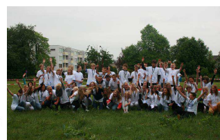
deelnemers beweegmarathon rolstoelfiets deelnemers sponsorloop